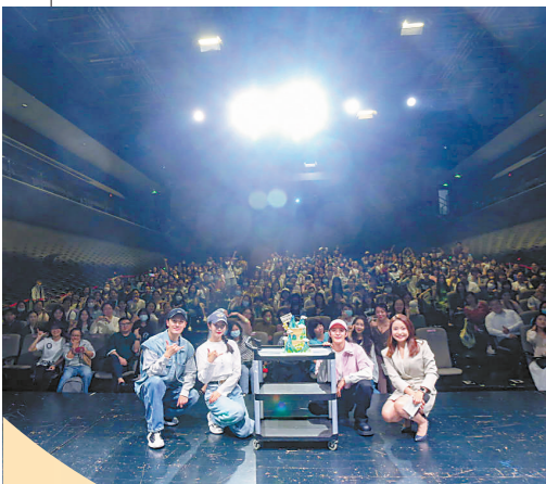
舞蹈诗剧《只此青绿》600场特别庆典活动现场

2025年也是上海总工会成立一百周年。上海话剧艺术中心将推出庆祝上海总工会成立百年演出季，四部剧目作为该演出季展演剧目上演：改编自巴金小说《团圆》以及长春电影制片厂拍摄的同名电影的大型话剧《英雄儿女》；根据同名电视连续剧改编的舞台剧《觉醒年代》；致敬中国左翼作家联盟五位烈士的舞台剧《浪潮》；展现20世纪80年代中国工人阶级奋斗图景的话剧《大桥》。羊城晚报记者 何晶