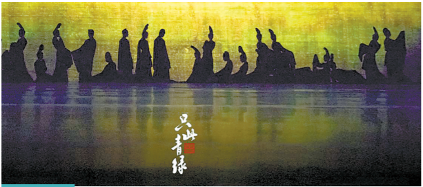
主创团队希望将《只此青绿》的这份荣耀传承下去