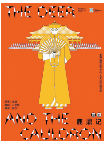
话剧《鹿鼎记》海报

此外，上海话剧艺术中心还将上演国家一级编剧喻荣军根据曹雪芹名著改编的全本话剧《红楼梦》；由中国香港导演司徒慧焯执导、取材于多个《西游记》版本的剧目《西游》；国家一级导演林