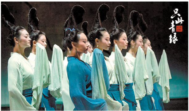
舞蹈诗剧《只此青绿》已面世三年多