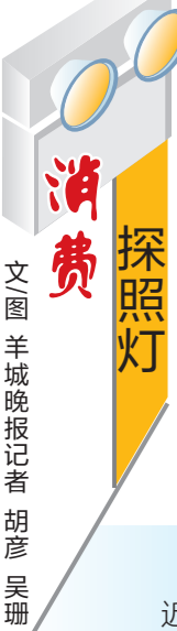
文图 羊城晚报记者 胡彦 吴珊

质量监督检验机构认证符号（CAL），代表检测站已经通过了CMA计量认证，可以承担国家行政机构下达的法定质量监督检验任务。消费者还可以在“中国合格评定国家认可委员会”的官方网站上，通过点击“检验机构认可”一栏，并输入CMA标志下方的数字编号等信息，了解检验机构是否具有相应资质。这一步骤有助于确保消费者权益，避免购买到假冒伪劣产品。