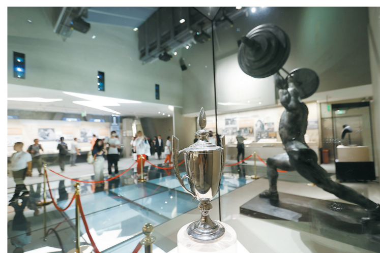
观众欣赏举重博物馆展出的展品

10月17日至28日，全国举重冠军赛暨第十五届全国运动会举重比赛资格赛将在石龙体育中心（石龙中学体育馆）举行。这是国内最高水平的举重赛事之一，来自全国各地67支代表队（女子代表队31支，男子代表队36支）、525名运动员将在石龙展开激烈角逐。