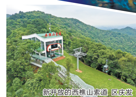
新开放的西樵山索道

为广东省“十三五”旅游业发展重点规划项目,开业时就采用开放式运营,市民和游客可以免费入园参观,如需游玩某个项目再单独买票。2019年中秋节假日仅3天创造了迎客超过16万人的佳绩。2018年成为国家5A级景区的惠州西湖风景名胜名区,早于2005年实行了取消主入口收费的政策,让景区周边的商业街区变得更加热闹,各种特色美食小吃、手工艺品店、特色民宿等应有尽有,为游客提供了丰富的选择和便利。