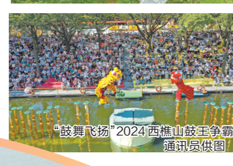
“鼓舞飞扬”2024西樵山鼓舞争霸赛