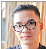
唐诗人 暨南大学文学院副教授