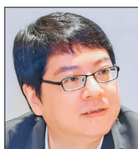
夏烈 杭州师范大学文化创意与传媒学院教授、中国作家协会网络文学研究院副院长