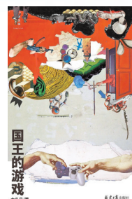
《国王的游戏》 大头马