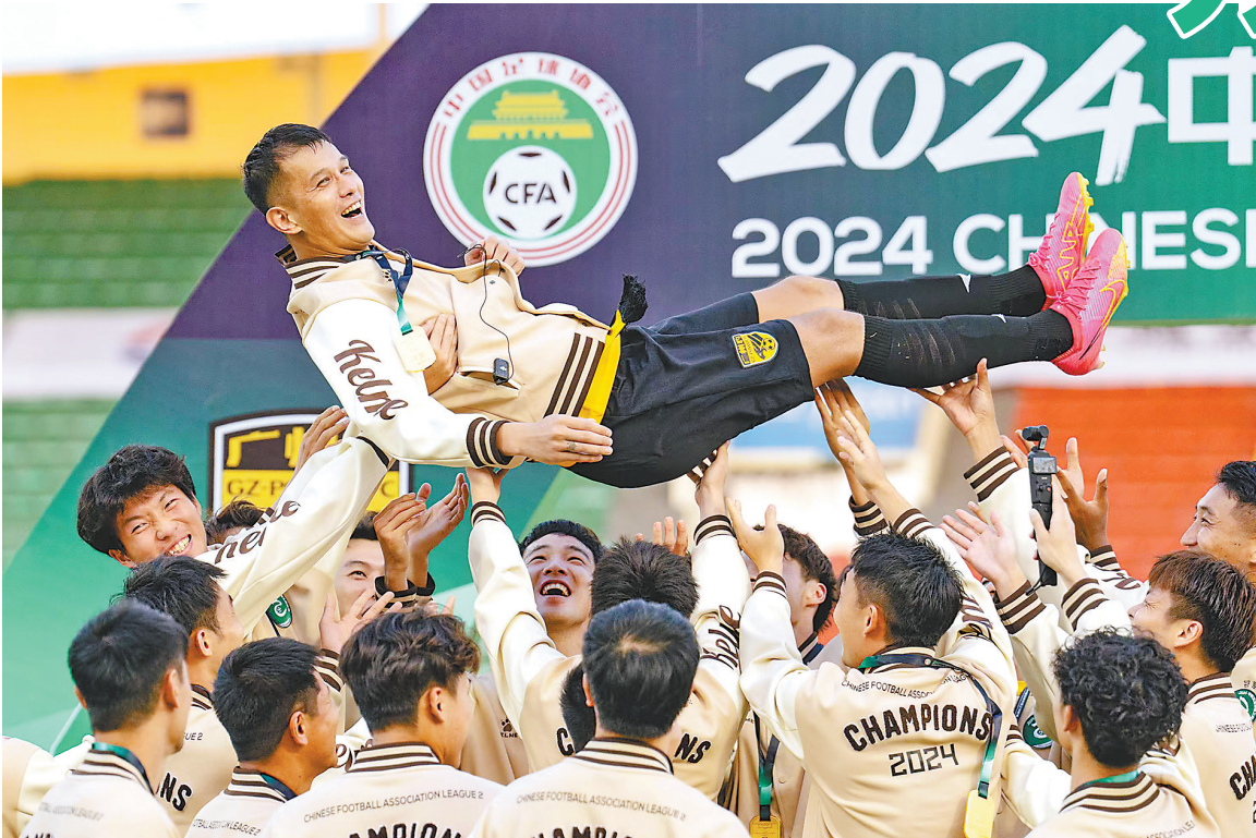
肖智被队友们抱起

肖智与广东缘分匪浅,1998年夏天,13岁的肖智曾在广州太阳神少年队试训并成功留下,师从陈熙荣、麦超。进入成年队后,他先后效力过南京有、河南队、广州富力、天津泰达、河北卓奥、青岛海牛、辽宁沈阳城市队和广州豹等多家俱乐部,其间更以32岁“高龄”入选国家队,共为国家队出场17次,打进3球助攻2次。其中两枚国家队进球含金量最高:一枚是2017年9月5日,肖智在世界杯预选赛亚洲区12强赛A组第10轮中进球扳平比分,帮助国家队在客场以2比1逆转卡塔尔队;另一枚是2019年1月20日,他在亚洲杯八分