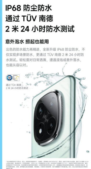
红米 Note 14 Pro系列宣传页面图/受访者提供

为进一步了解，近日，记者线下走访了广州天河、海珠、番禺等多家小米之家门店，咨询 Redmi Note 14 Pro系列手机的防水性能，得到的口头介绍较为一致，“新品经过了多项防水认证”“这款手机可以随便泡”。此外，手机样机详情页上方大字显示“意外泡水，捞起也能用”“轻松面对日常洒溅，遭遇浸泡或意外落水，也能从容应对”。仔细查看，才留意到该页面最下方还有一段字极小、浅灰色的提示——“本系列产品非专业防水手机……日常使用请勿将手机浸入水中，或接触海水等溶液或饮品等液体。”