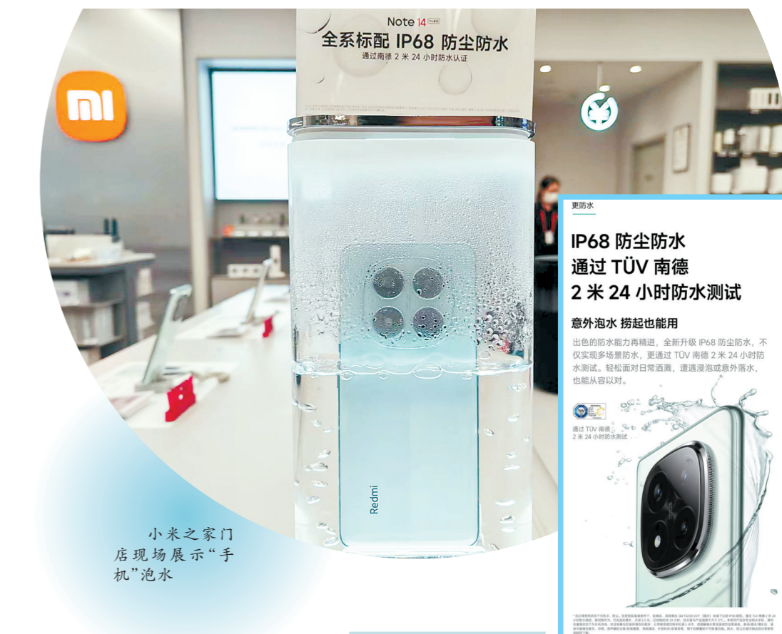
小米之家门店展示“手机”泡水

可是，5厘米不到的水深，不到30秒的浸泡时间，手机就进水了，是不是防水性能“有水分”？一位手机维修从业人员向记者科普，大部分手机厂商的“防水”做法有三种，一是通过密封胶圈裹住元器件，例如SIM卡托、充电接口内部，进而隔绝水的进入；二是将耳机孔、充电口等裸露在外的