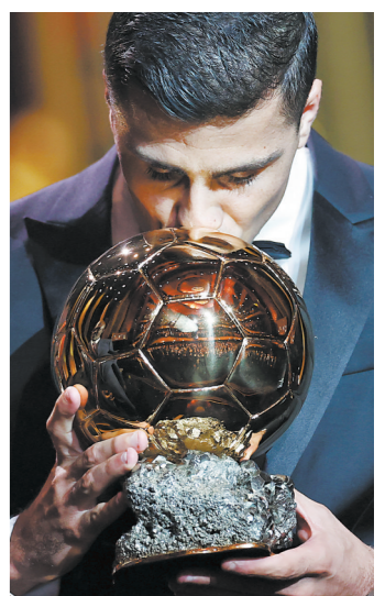
罗德里在颁奖典礼上亲吻奖杯

罗德里承前启后地夸奖西班牙球员:“对于许多像哈维、伊涅斯塔、卡西利亚斯这样没有赢得过金球奖的球员来说,这是西班牙足球的胜利。亚马尔将很快赢得金球奖,我对此深信不疑。坚持下去,继续努力,你就会达成。” 2023年金球奖评奖周期是从2022年8月1日到2023年7月31日,恰好包括在2022年底进行的卡塔尔世界杯,获得世界杯金球奖的世界杯冠军阿根廷的队长梅西荣膺2023年金球奖,世界杯金靴奖姆巴佩排名第三;曼城球员属于另一个序列,在2023年金球奖周期内成为欧冠、英超、足总杯“三冠王”,但哈兰德、德布劳内、罗德里只能分列第二、第四和第五。 2024年金球奖评奖周期是从2023年8月1日到2024年7月31日,罗德里在此期间帮助西班牙夺得2024欧洲杯冠军并获评欧洲杯最佳球员,还帮助曼城实现史无前例的英超四连冠,最终在本届金球奖评选中得偿所愿。 羊城晚报记者 刘毅