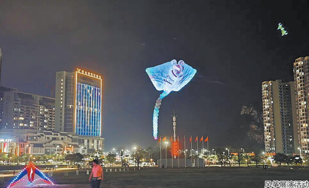
风筝展演活动现场