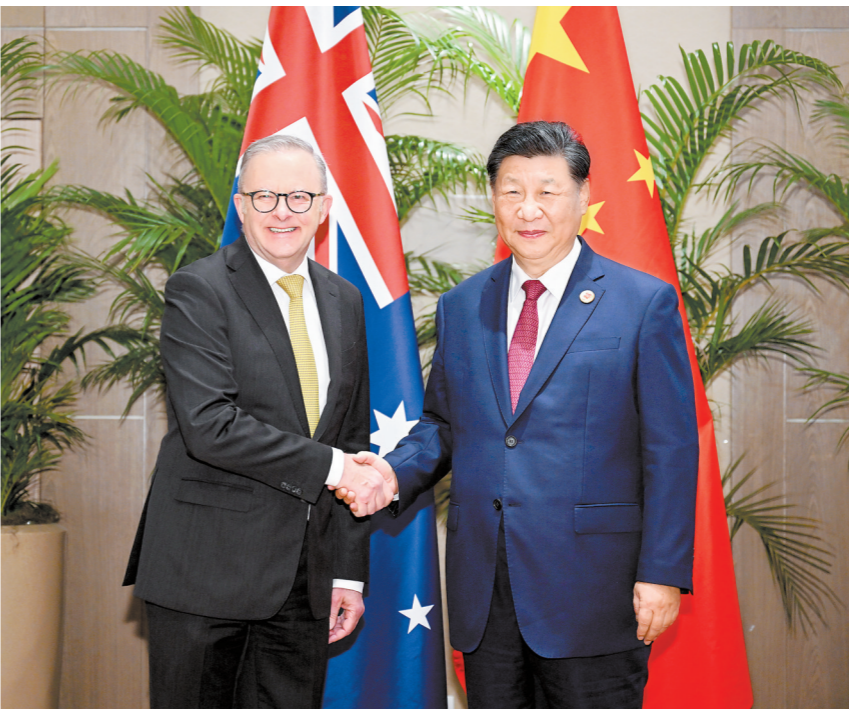
当地时间11月18日上午，国家主席习近平在里约热内卢出席二十国集团领导人峰会期间会见澳大利亚总理阿尔巴尼斯

新华社里约热内卢11月18日电 当地时间11月18日上午，国家主席习近平在里约热内卢出席二十国集团领导人峰会期间会见澳大利亚总理阿尔巴尼斯。习近平指出，去年11月，我们在北