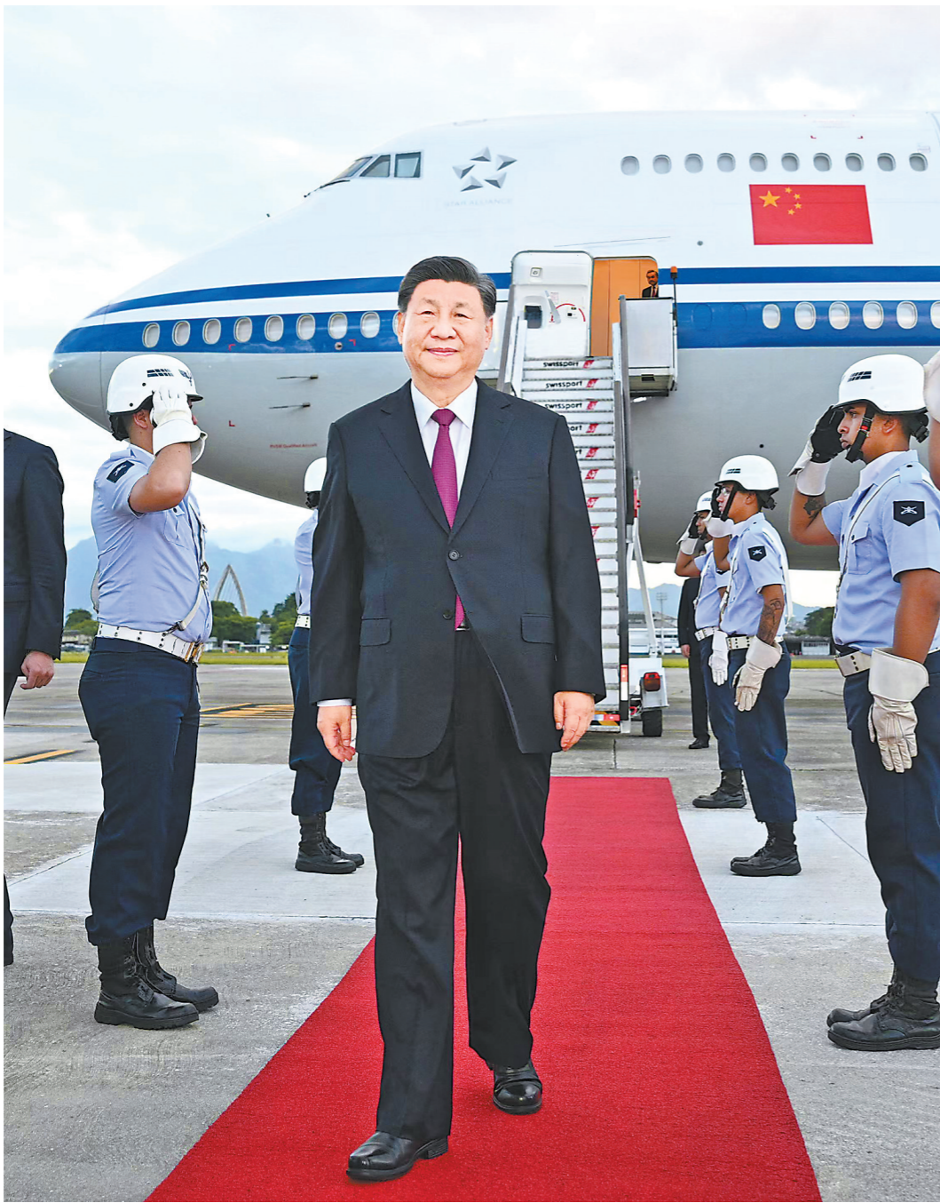
当地时间11月17日下午，国家主席习近平乘专机抵达里约热内卢，应巴西联邦共和国总统卢拉邀请，出席二十国集团领导人第十九次峰会并对巴西进行国事访问

新华社里约热内卢11月17日电 当地时间11月17日下午，国家主席习近平乘专机抵达里约热内卢，应巴西联邦共和国总统卢拉邀请，出席二十国集团领导人第十九次峰会并对巴西进行国事访问。