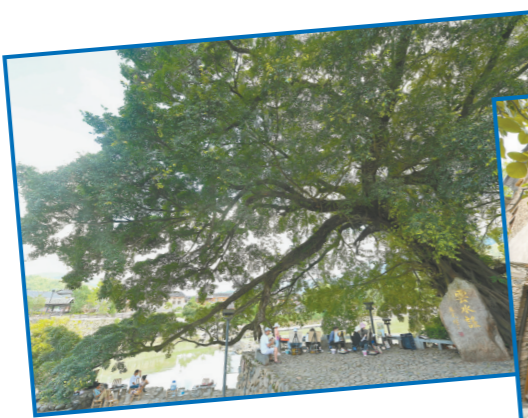
福建省漳州市南靖县书洋镇官洋村云水谣景区

位于湖南省湘西土家族苗族自治州花垣县,是“精准扶贫”理念的源起之地。通过文旅融合激发乡村发展新动能,该村依