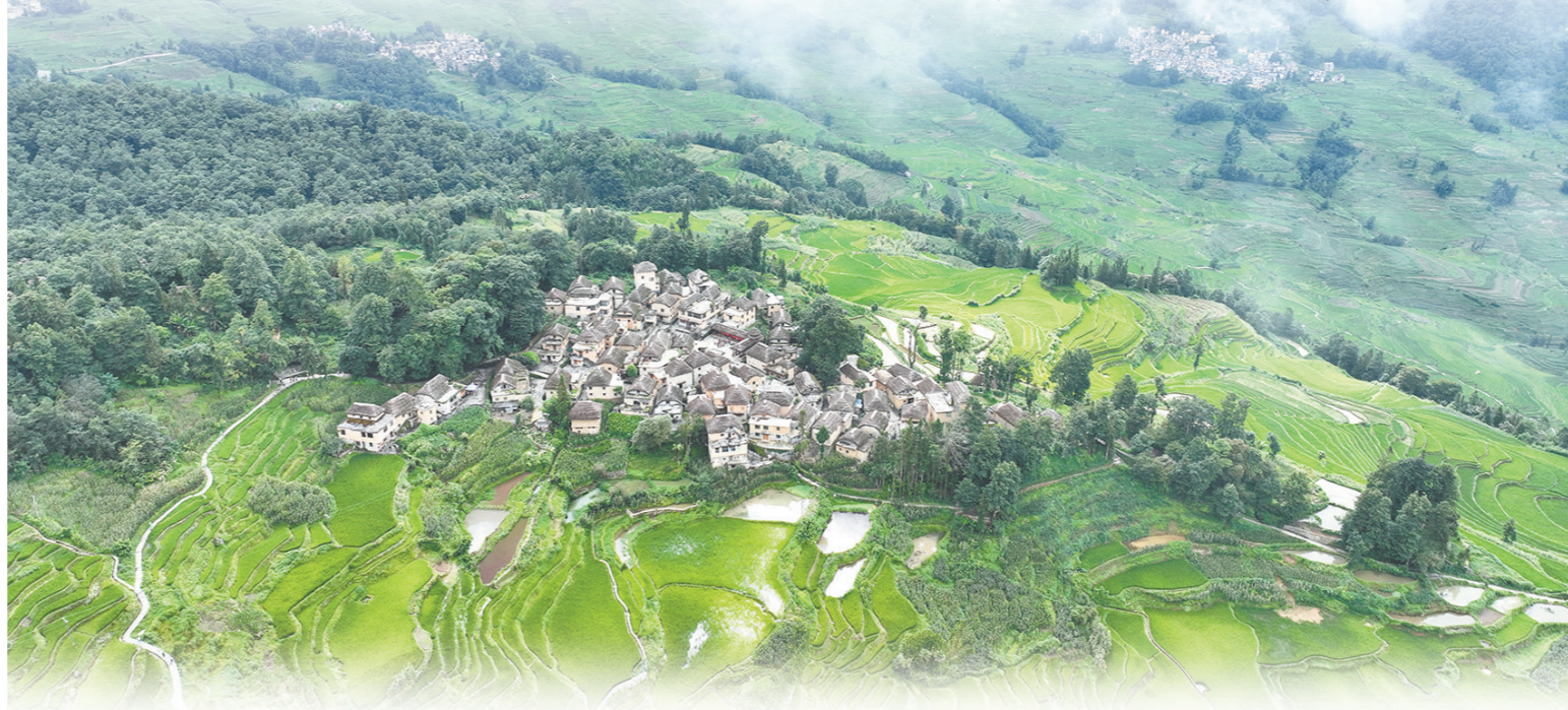
云南省红河哈尼族彝族自治州元阳县阿者科村风光

北京时间11月15日,在哥伦比亚卡塔赫纳举行的联合国旅游组织执行委员会第122次会议上,2024年“最佳旅游乡村”名单正式公布,我国申报的云南阿者科村、福建官洋村、湖南十八洞村、四川桃坪村、安徽小岗村、浙江溪头村、山东烟墩角村7个乡村入选,是本届入选乡村最多的国家。至此,我国“最佳旅游乡村”总数达到15个,位居世界第一。