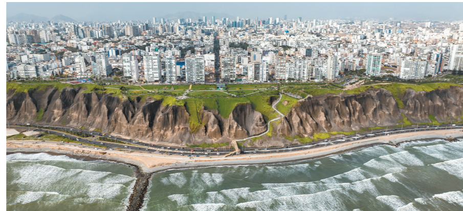
秘鲁首都利马新城米拉弗雷斯区

一直以来,中国游客对拉美国家丰富的自然景观、多元的文化和悠久的历史充满好奇与向往,赴拉美旅游持续升温。随着亚太经合组织(APEC)峰会和二十国集团(G20)峰会相继在秘鲁和巴西举办,进入“拉美时间”,秘鲁首都利马和巴西大城市里约热内卢吸引了全球目光,它们对于旅行者而言,也是充满惊喜的旅游胜地。一向市场定位高端的“拉美+南极”旅游产品,也展现出巨大的市场潜力。