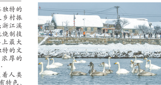
雪后的山东省荣成市烟墩角村景色