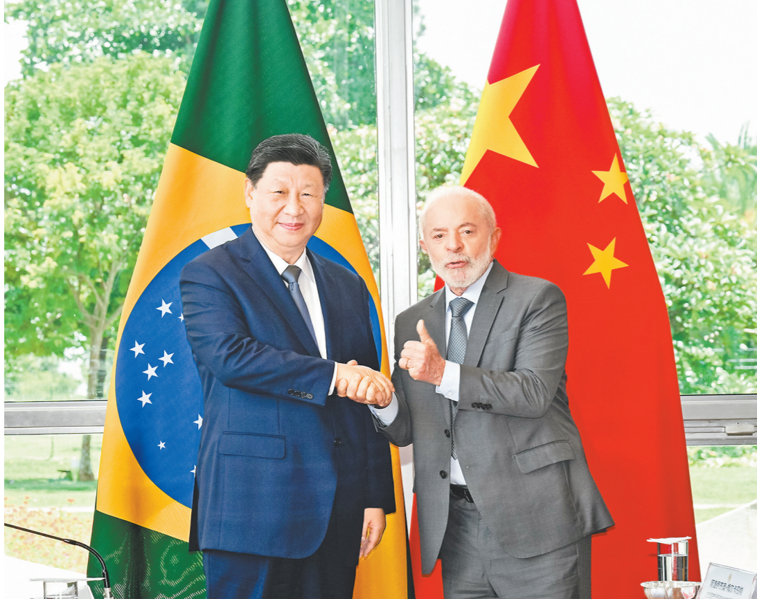
当地时间11月20日上午，国家主席习近平在巴西利亚总统官邸黎明宫同巴西总统卢拉举行会谈