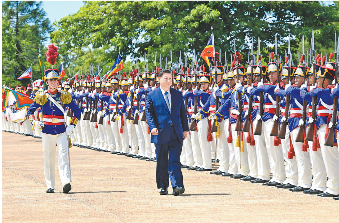
当地时间11月20日上午，国家主席习近平在巴西利亚总统官邸黎明宫同巴西总统卢拉举行会谈。会谈前，卢拉总统和夫人罗塞拉热情迎接习近平，并为习近平举行隆重盛大欢迎仪式

新华社巴西利亚11月20日电 当地时间11月20日上午，国家主席习近平在巴西利亚总统官邸黎明宫同巴西总统卢拉举行会谈。两国元首宣布，将中巴关系定位提升为携手构建更公正世界和更可持续星球的中巴命运共同体。