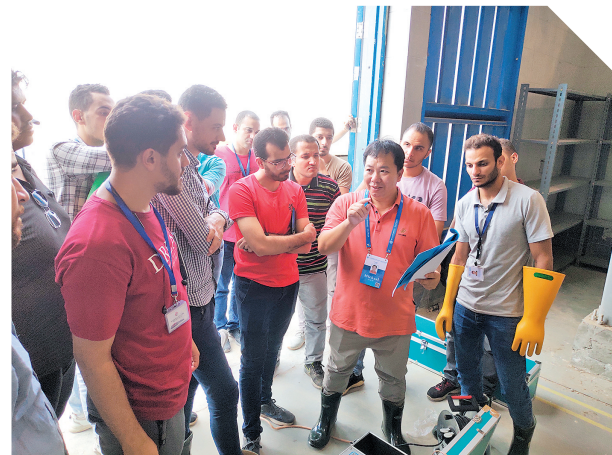
广州铁职院专业群骨干教师为埃及学生讲解高压实验实操要点