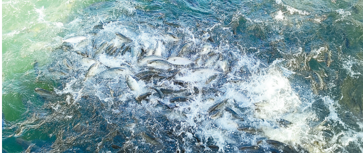
珠海“格盛1号”上养殖的草红色