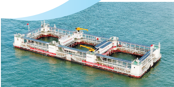
珠海“格盛1号”俯瞰图

现代化海洋牧场是怎么养鱼的？养出的鱼有什么特别之处？大海深处风高浪急，会不会上演獐子岛扇贝“跑路”的戏码？近期，羊城晚报采访组出海探访珠海“格盛1号”养殖平台，看到大海深处养大鱼的壮阔画面时，已经开始期待明年草红色的丰收了。