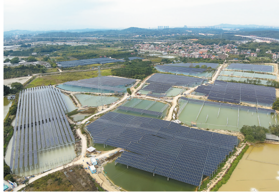
花都赤坑“破谷小镇”渔光互补光伏发电项目航拍图

目前，花都供电局正加速制定支撑服务花都国家级经济技术开发区高质量发展工作计划。接下来，该局将继续深度融合和服务“百千万工程”，将标杆供电局建设与乡村电气化一体推进，探索打造分布式光伏汇集上网典型示范，做好花城村经验总结，支撑花都绿色低碳配电网建设。