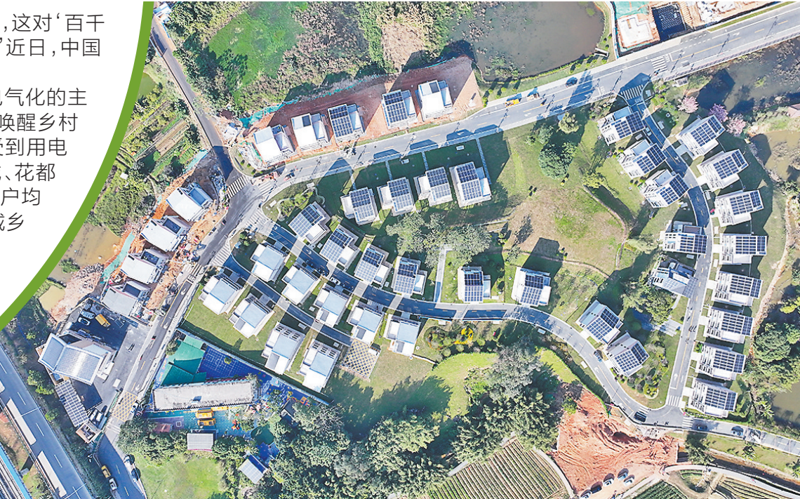
广东首个“未来乡村”智慧配电网示范在广州黄埔迳下村建成