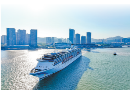
爱达·地中海号驶离南沙国际邮轮母港

爱达·地中海号将融合岭南地域文化、传统节庆文化等，为华南游客打造一系列别具特色的邮轮文化体验。基于此次航季刚好覆盖元旦、春节、元宵等节日，爱达·地中海号精心设计了丰富的节