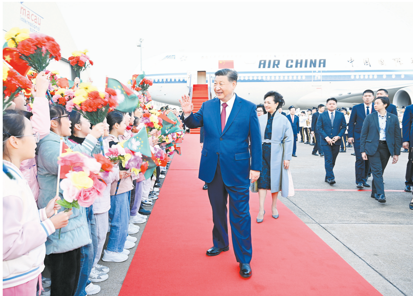
12月18日下午，中共中央总书记、国家主席、中央军委主席习近平乘专机抵达澳门，出席将于20日举行的庆祝澳门回归祖国25周年大会暨澳门特别行政区第六届政府就职典礼并视察澳门。这是习近平和夫人彭丽媛向欢迎人群致意

新华社电 中共中央总书记、国家主席、中央军委主席习近平18日下午乘专机抵达澳门，出席将于20日举行的庆祝澳门回归祖国25周年大会暨澳门特别行政区第六届政府就职典礼并视察澳门。