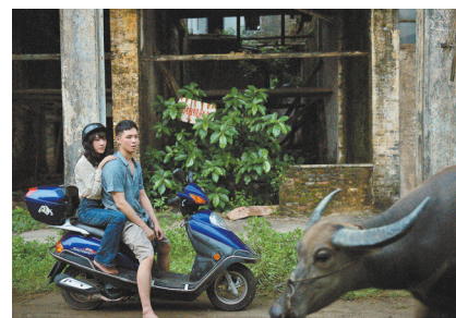
《炉底糕就是华夫饼》剧照

山海展映季·巴黎活动期间,山海计划为法国观众带来一套限定周边,其中“寻影岭南”冰箱贴套装设计提取了9部短片9个取景地的特色地标和文化符号,包括广州花都塱头古村、湛江中华白海豚、佛山南狮、澳门大三巴牌坊、揭阳神泉港、深圳大梅沙盐田港、清远英西峰林、江门碉楼、汕头英歌舞等,创意展示气象万千的岭南风光。