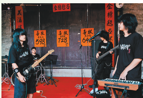
《落水天沉落去》剧照