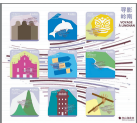
“寻影岭南”冰箱贴套装