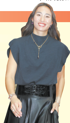
赛场外的郑钦文同样神采奕奕