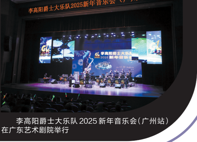
李高阳爵士大乐队2025新年音乐会(广州站)在广东艺术剧院举行