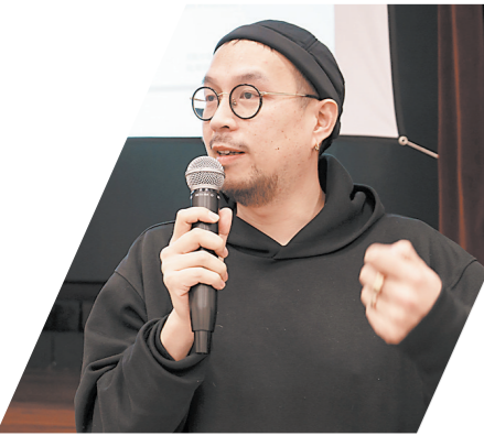
《陈小姐的森林》导演杜来顺