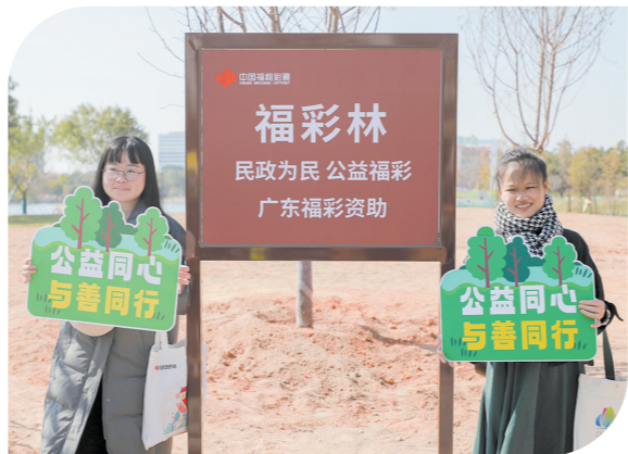
活动现场参与者纷纷在福彩林打卡留念

参与植树的福彩工作人员表示，参加“福彩林”植树活动非常有意义，种下一棵树就是种下新的希望，造福后代。“正如我们从事的福彩事业，汇聚万千彩民的力量浇灌公益事业之树，结出惠民利民的暖心果实，为社会造福，为生活添彩。”