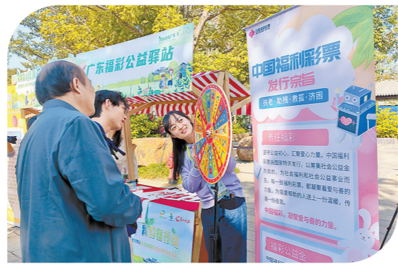
广东福彩的公益展位吸引了市民、游客驻足