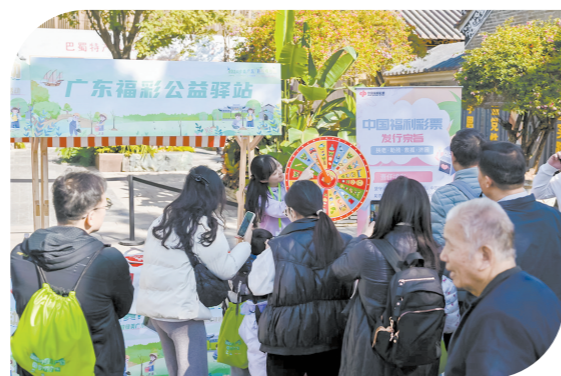
广东福彩的公益展位人气十足