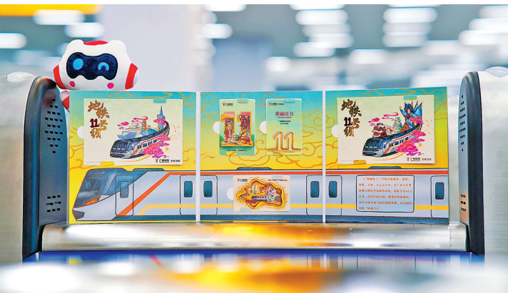
广州地铁十一号线开通纪念票

该套纪念票售价100元/套，感兴趣的市民可前往琶洲、华师、云台花园、中医药大学、彩虹桥、如意坊、芳村、江泰路、大塘、万胜围十个站点的客服中心线下购买，或通过“广州地铁博物馆”微信小程序商城购买。