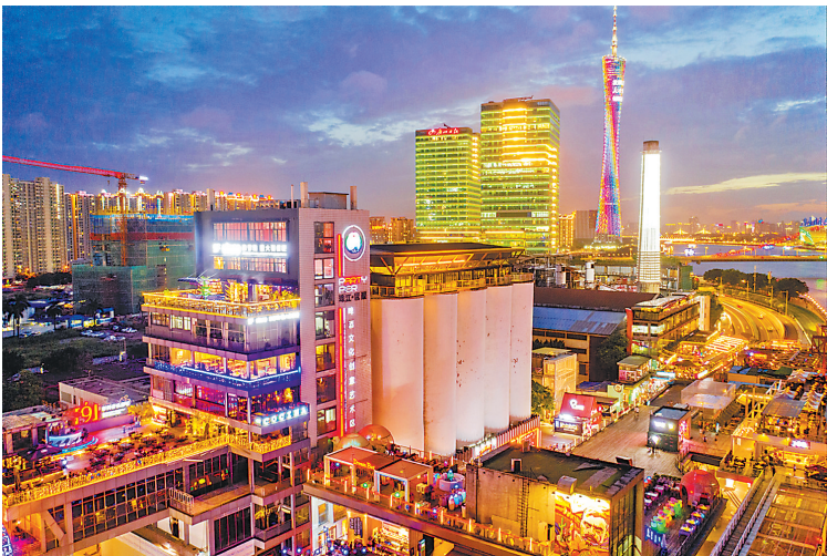
广州塔广场是广州塔—琶醍美食集聚区的核心载体