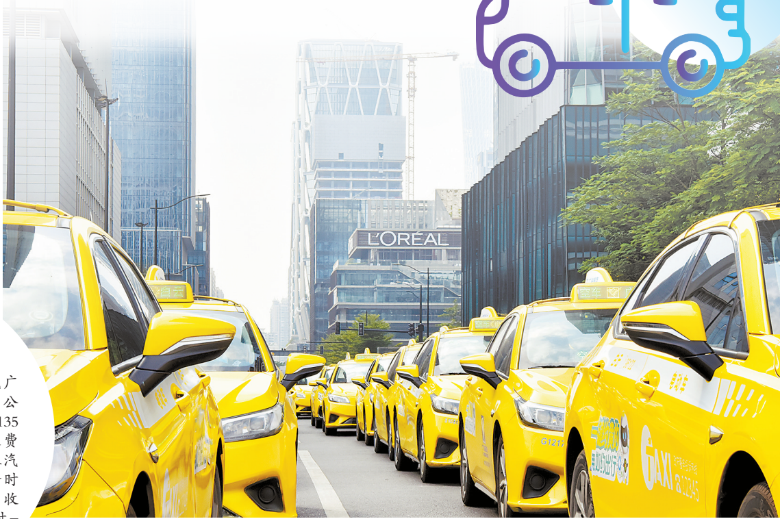
广州巡游出租车运价明年有变 资料图

假设乘客A打车，从花城广场出发到广州塔，路程大约5公里，中途等红绿灯慢行约135秒。按照浮动前运价标准，收费约19元；按照目前各巡游出租汽车企业公示的运价标准，高峰时段（7时—9时，17时—19时）收费约21元，平峰时段（12时—14时）收费约17元。