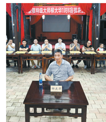
中国象棋特级大师柳大华以一对八盲棋表演