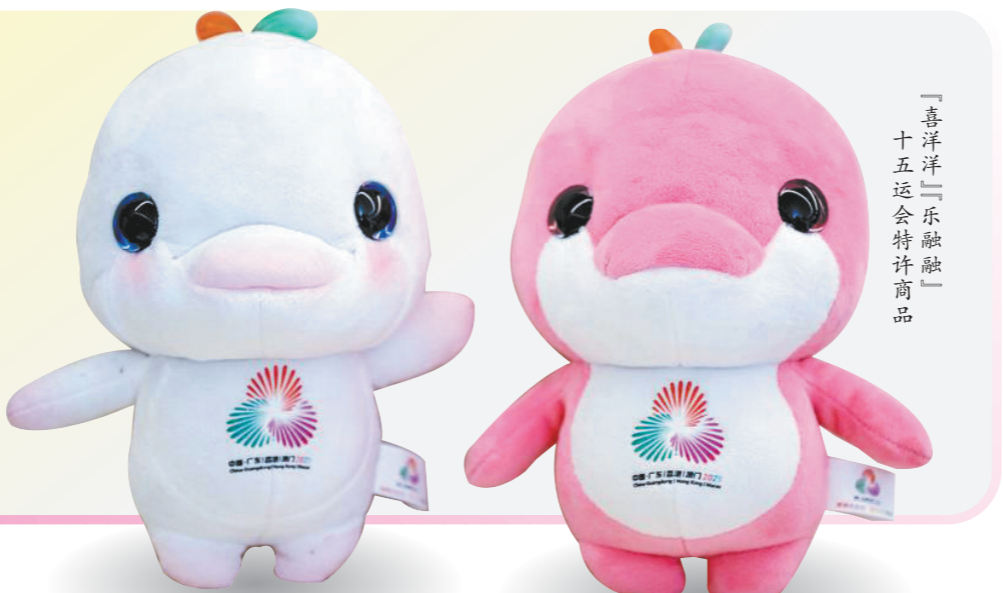
「喜洋洋」「乐融融」十五运会特许商品