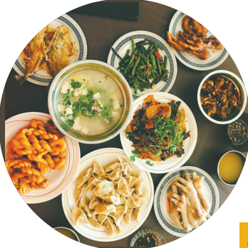
海法自己制作的中国美食

提到大学生，国内普遍联想到的是一群20岁左右的年轻人，但在苏丹喀士穆国际阿拉伯语学院的学生群体中，40-50年龄段的中年人也占了不小的比重。他们大部分都已经为人父母，以培养苏丹的阿拉伯语师资为目标来到高校进修。“苏丹同学无论是什么年龄段的，在考试季总是和我们中国同学聚在一起，大家一起讨论复习，帮助我们查缺补漏等等。”