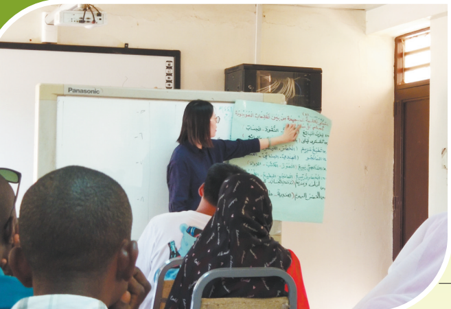
喀士穆国际阿拉伯语学院课堂