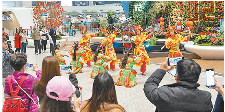
汕头潮阳西门英歌队“闪现”广州白云国际机场

1月27日晚，广州白云国际机场候机大厅与往常大不相同，竟然响起了阵阵哨声和棒槌的敲击声，让行色匆匆的旅客们纷纷停下脚步。