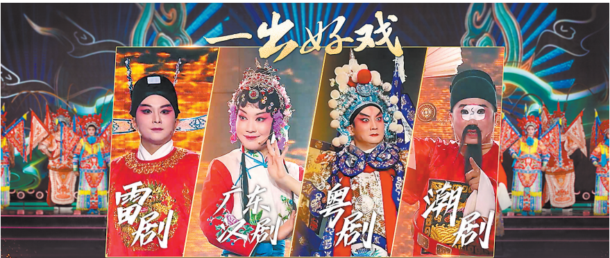
《一出好戏》汇聚粤潮雷汉四大戏种