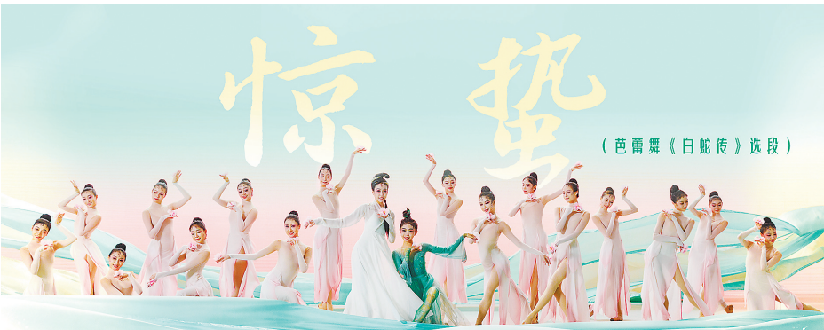
《惊蛰》带来“粤式”蛇舞的创新表达