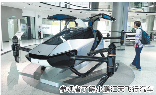
参观者了解小鹏汇天飞行汽车

在支持绿美广东生态建设方面,2024年,省财政通过加强投入保障、创新实施试点、优化政策机制等方式,加大力度支持绿美广东生态建设各项任务,推动绿美广东充分发挥生态效益、经济效益、社会效益。2024年投入22.92亿元,通过“以奖代补”“先考后奖”等方式,推动超额完成林分优化提升、森林抚育提升“两个200万亩”任务,推进绿美广东示范项目建设。