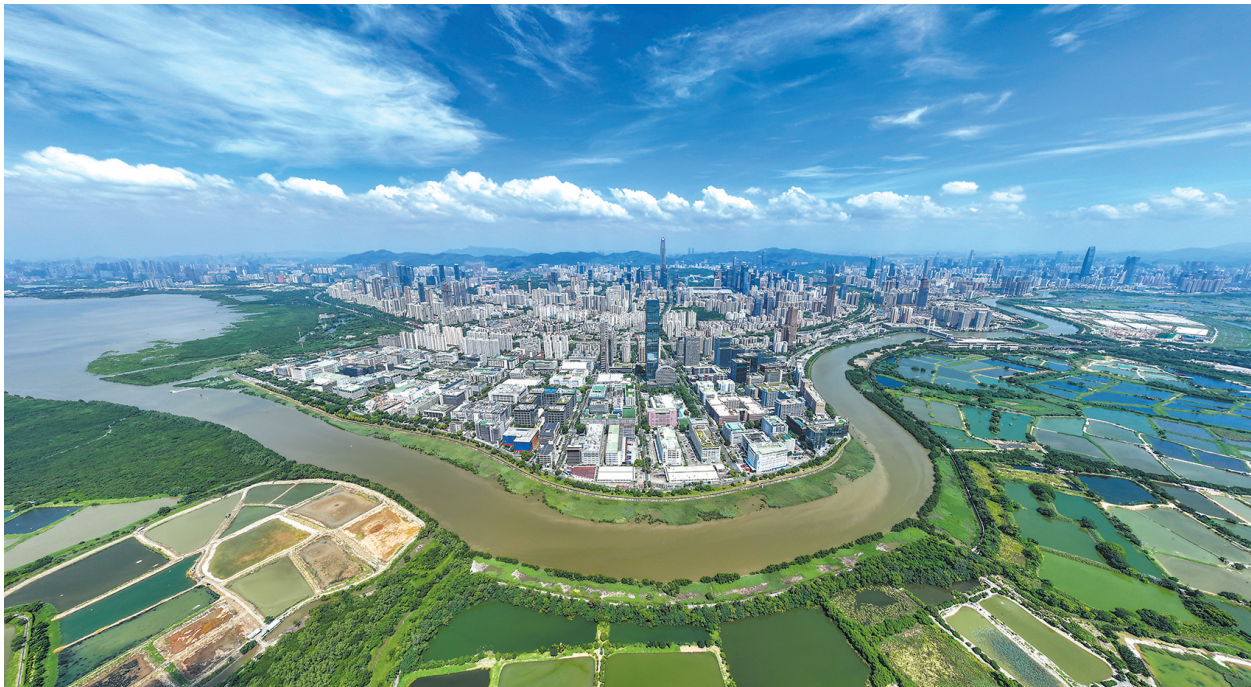
河套深港科技创新合作区及深圳河两岸风光

回顾2024年,广东财政如何适度加力、提质增效,为经济大省挑大梁发挥出财政应有作用?展望2025年,广东财政如何稳中求进、以进促稳,促进广东经济持续回升向好?近日,羊城晚报记者围绕上述问题采访了广东省财政厅。