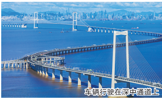
车辆行驶在深中通道上

为促进实体经济和数字经济深度融合,广东投入32亿元,全面落实技改支持政策,加快中小企业数字化转型城市试点工作,全年推动超1万家企业开展技术改造和数字化转型,广州、深圳入选国家制造业新型技术改造城市试点,广州、中山入选第二批国家级中小企业数字化转型城市试点。