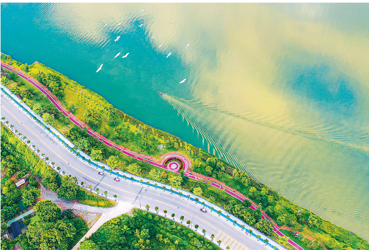
▲广州增江画廊碧道

站在“十四五”规划的关键节点上,绿意盎然的“花城”广州,必将在绿色发展的康庄大道上稳步前行、行稳致远,以坚定的步伐奋力书写人与自然和谐共生的崭新篇章,向着更加美好的未来阔步迈进。