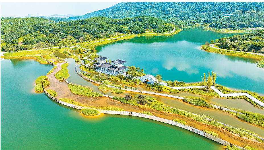
广州知识城—适下美丽单元建设项目