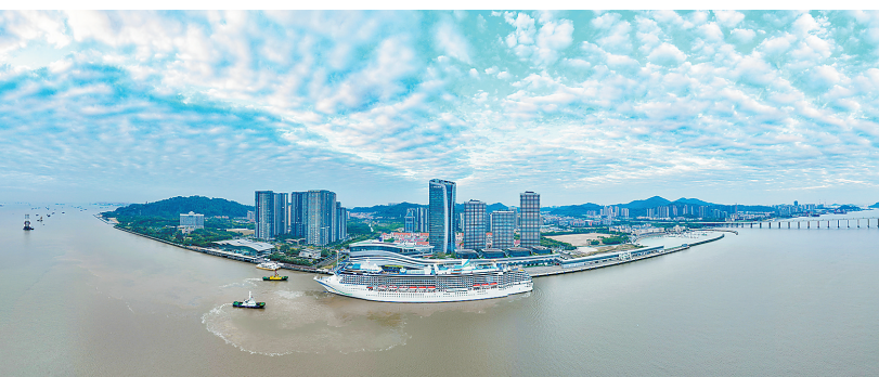
南沙国际邮轮母港