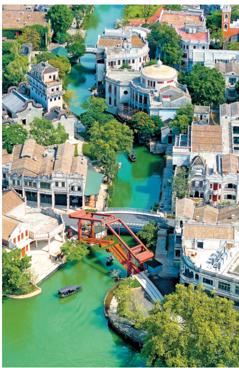
▲赤坎华侨古镇正式开业