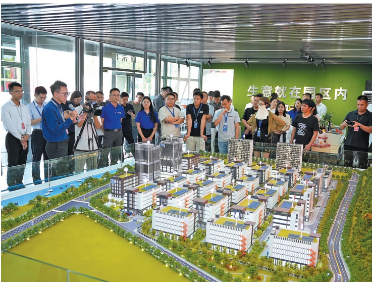
▲大量深圳、香港企业前往江门考察