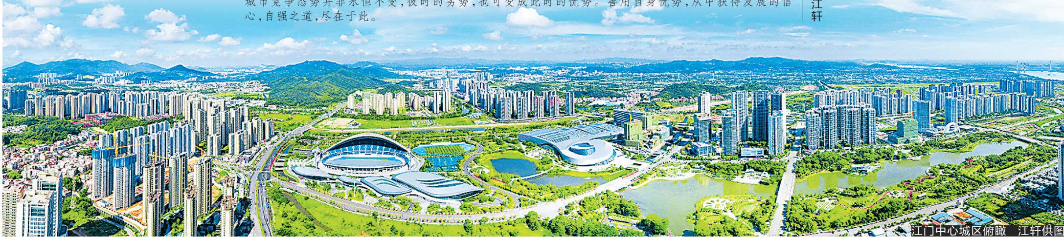
江门中心城区俯瞰