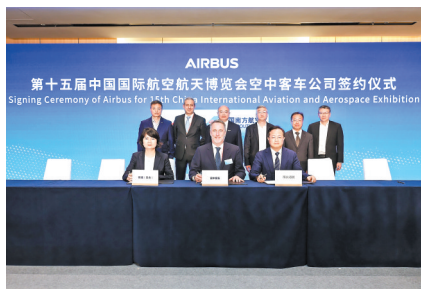
恒健控股公司下属天合租赁与空中客车直升机公司、南航通航签署合作意向书

作为广东省级国有资本运营公司和省委、省政府重大战略投资平台,2024年,广东恒健投资控股有限公司(下称“恒健控股公司”)实现扩投资、提能级,推动一批具有全局突破性、引领性的重大项目落地广东,助力横琴引入首个跨国500强公司区域总部,主营业务核心竞争力持续提升,“恒健系”基金规模达1875.30亿元,高质量发展再上新台阶。