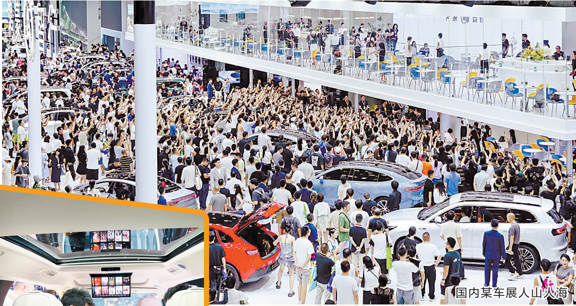
国内某车展人山人海

深蓝汽车和极氪汽车也表现出色。深蓝汽车2月全球交付1.87万辆,同比增长约87%;极氪汽车2月交付1.4万辆,同比增长86.9%,环比增长17.6%。若将领克品牌计算在内,极氪科技集团2月新车销量为3.12万辆。蔚来汽车2月份交付新车1.32万辆,同比增长62.2%。岚图汽车和智己汽车也分别实现了8013辆和7037辆的交付量,同比增长分别达到了152%和70%。