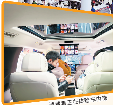
消费者正在体验车内饰

在当前市场环境下,各大造车新势力加速新车发布,争夺市场份额。2月28日,小鹏汽车2025款G6首次亮相,小鹏汽车董事长何小鹏透露新车已到店,下周即将正式发布,但因供应链紧张,首月产量有限。此外,2月份,小鹏G6右舵版在英国预售,小鹏X9首批300辆从广州南沙港正式登船发运海外。