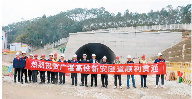
广湛高铁新安隧道贯通,标志着全线50座隧道顺利落成

3月1日,由省铁投集团所属广湛铁路公司投资建设的广湛高铁新安隧道全隧安全顺利贯通,至此,广湛高铁全线50座隧道全部顺利贯通,为后续全线无砟轨道施工扫除了障碍,广湛高铁项目建设取得阶段性突破性进展。