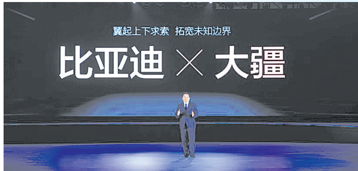
为“灵鸢”智能车载无人机系统,并定名为“比亚迪携手大疆发布智

3月2日,比亚迪携手大疆,在深圳举办了智能车载无人机系统发布会,并将该系统正式定名为“灵鸢”,以此推动智能车载无人机系统的产业化和规模化发展。截至目前,比亚迪已经和多家世界级科技企业达成了战略合作。智能车时代的新竞争焦点,再一次由比亚迪点燃。