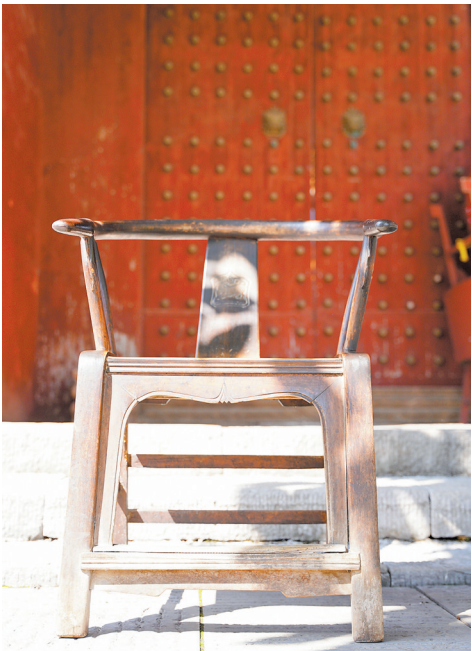
宁远文庙崇圣祠前,石阶、朱门、木椅保留完好,只是斯人已逝