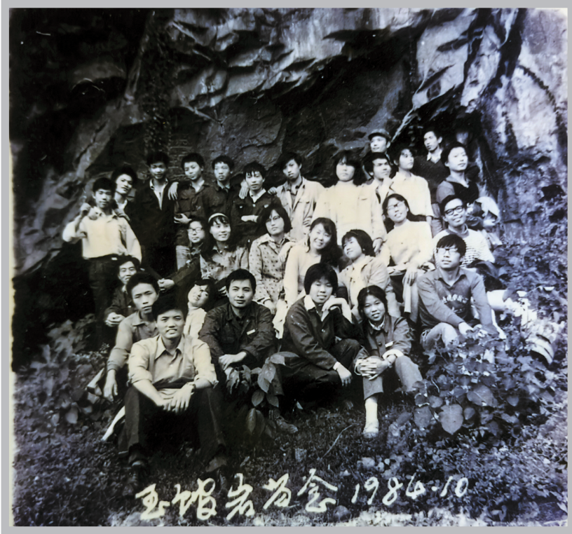
1984年10月,82级文史系班级活动,同学们在玉琯岩合影