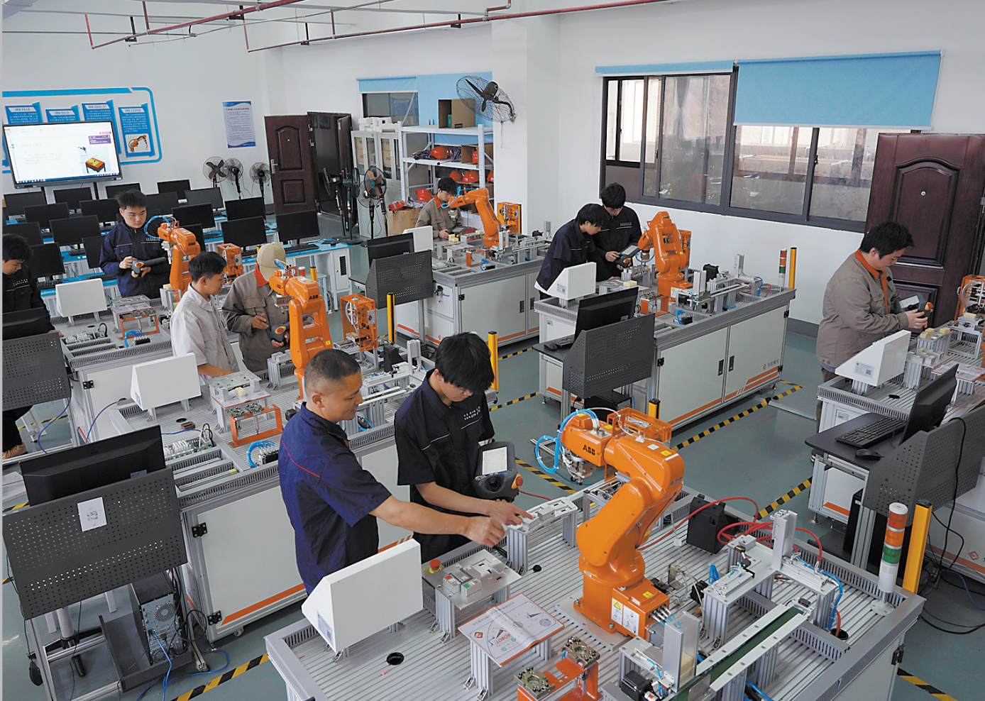
如今九嶷职业技术学院的机电一体化技术实训室