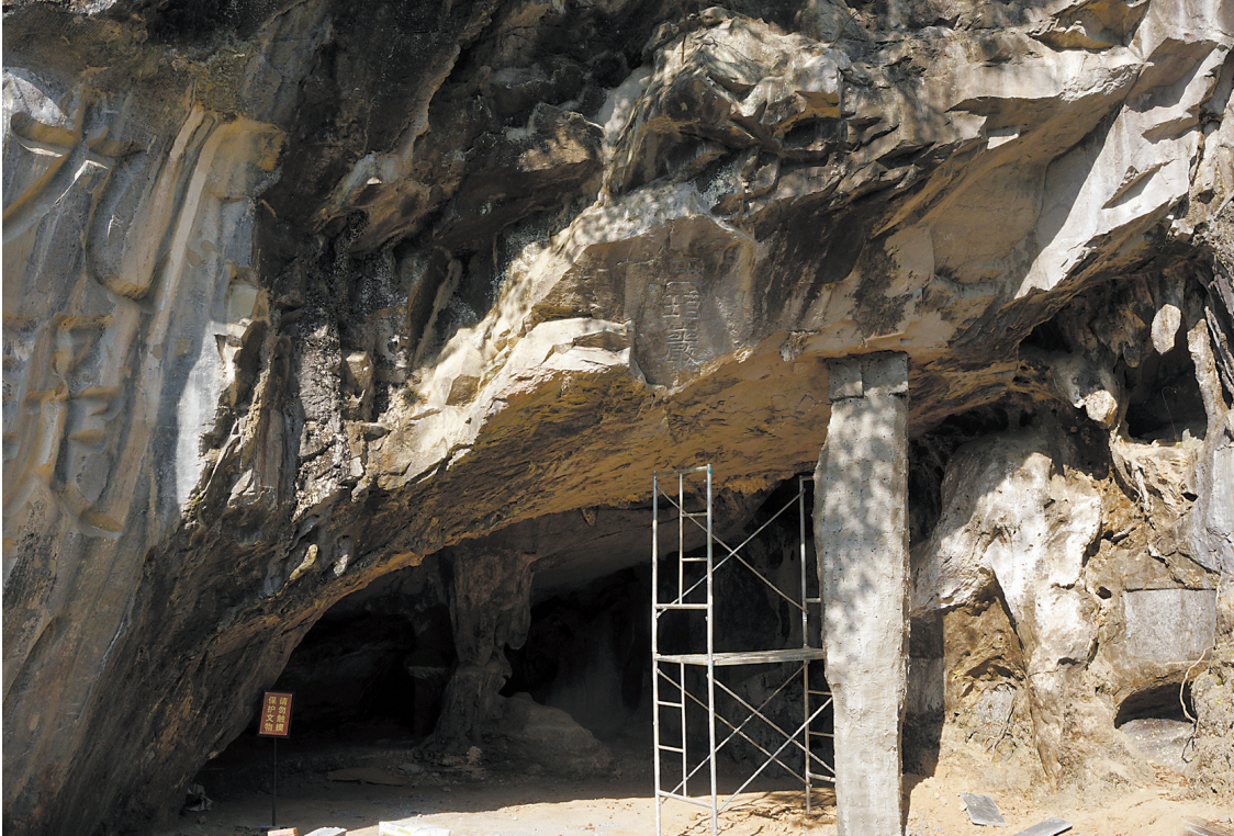
如今的玉琯岩景观正在维护修复