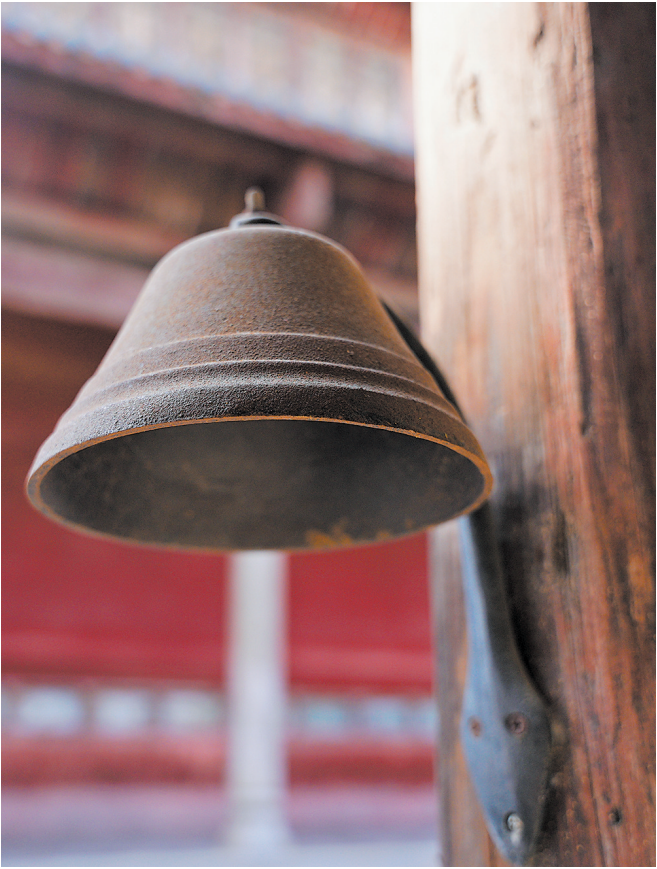
文庙厢房前的上课铃