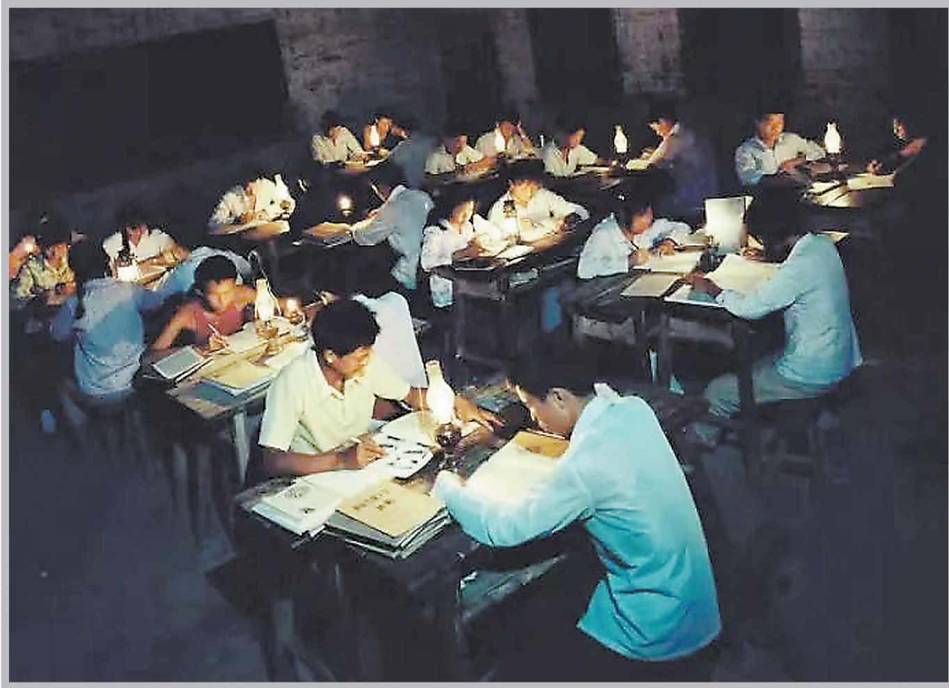
获1984年全国摄影大赛最佳奖,羊城晚报记者在九嶷山学院拍摄的《煤油灯下新一代》