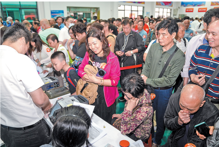
村民喜笑颜开，排队办理手续

4月26日，广州三元里村城中村改造项目第一批集中签约仪式在三元里小学举办，现场向首批已签约权属人派发1万元现金奖励，并向符合条件的权属人发放一封信，明确房屋搬迁交付后将发放《停车位使用权奖励确认书》。