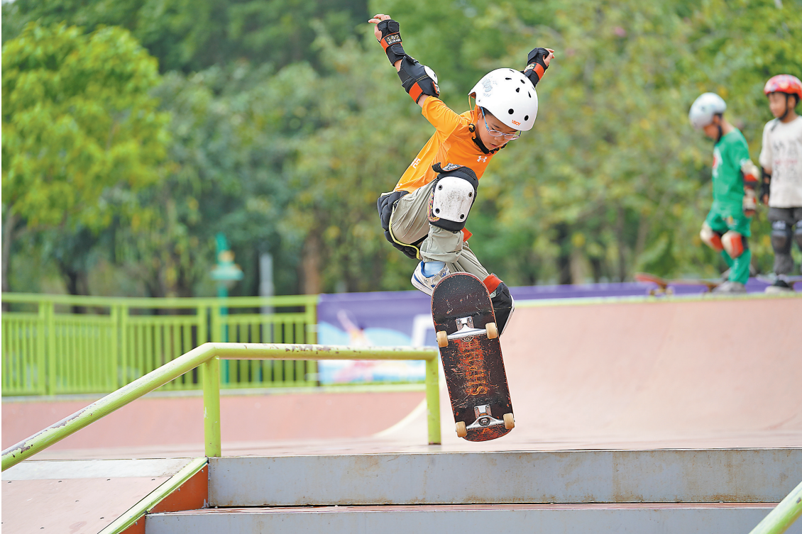
小将们纷纷拿出“绝活”

羊城晚报讯 4月26日，广州市第一届青少年滑板公开赛决赛正式打响。广州市儿童公园变身“极限战场”，10后滑板少年纷纷上演高难度“空中芭蕾”。作为“十五运会”倒计时