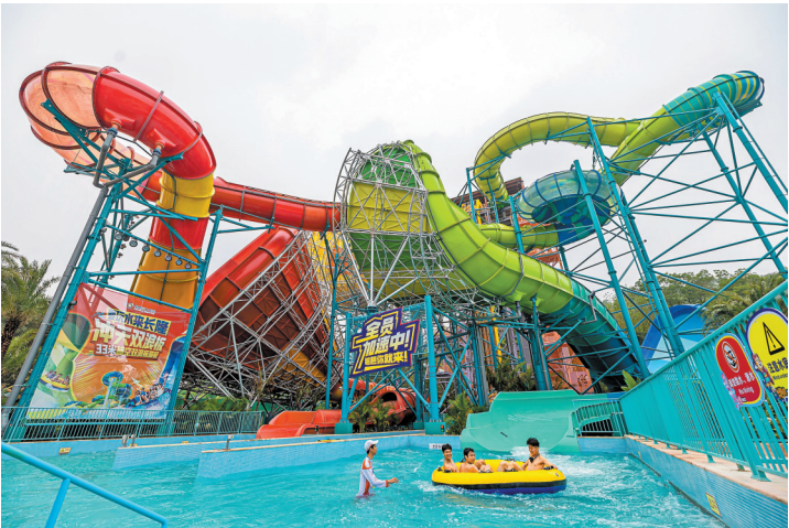
磁力炮水上过山车

除三大新设备外，深受年轻人喜爱的“水上超级电音派对”也将返场，带来音乐狂潮。届时，长隆将以科幻特效打造现场，12台高射水炮随低音震撼，火焰与烟花在电音派对高潮中炸裂夜空，拉开夏日玩水序幕。此外，游客还可在乐园内体验“摇滚巨轮”，这也是全球第一台自带动力系统并能够自主旋转的玩水设备。