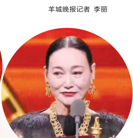
惠英红凭借《我爱你！》获优秀女演员奖