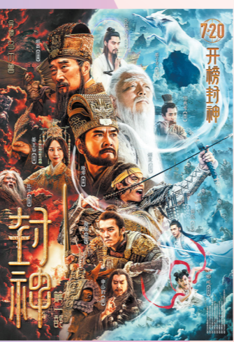
《封神第一部:朝歌风云》海报