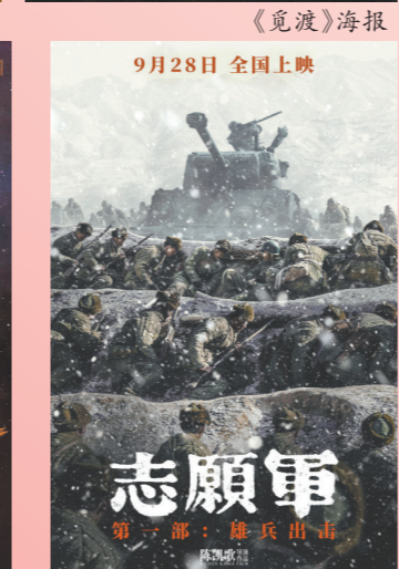
《志愿军:雄兵出击》海报