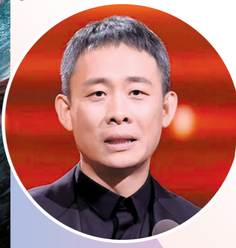
张译凭借《三大队》获优秀男演员奖