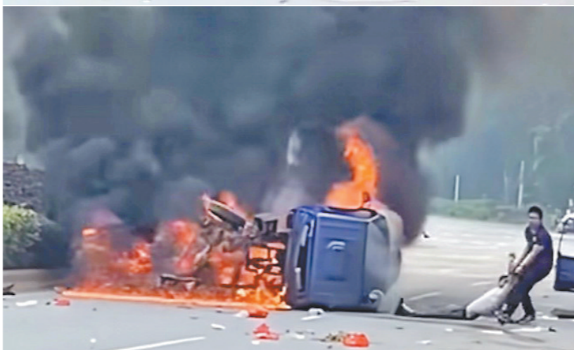
救援过程 视频截图