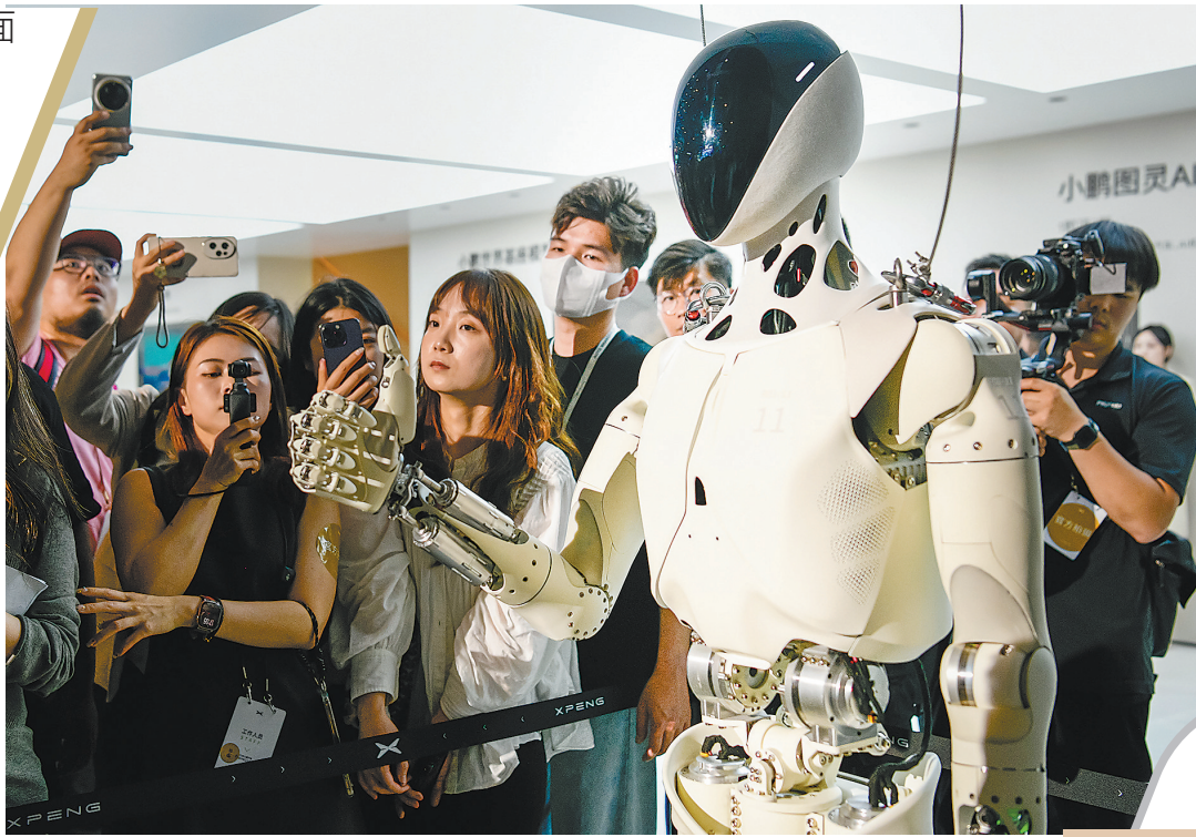
上市公司在研发投入上持续发力，不断激活新质生产力