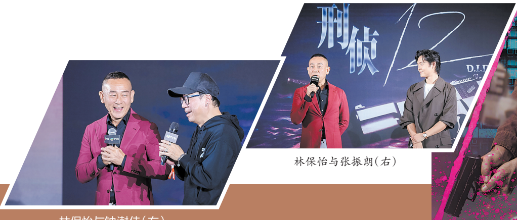
林保怡与张振朗(右)

5月9日，《刑侦12》媒体看片会在广州举行，羊城晚报受邀参加并采访了监制钟澍佳、导演巢志豪。