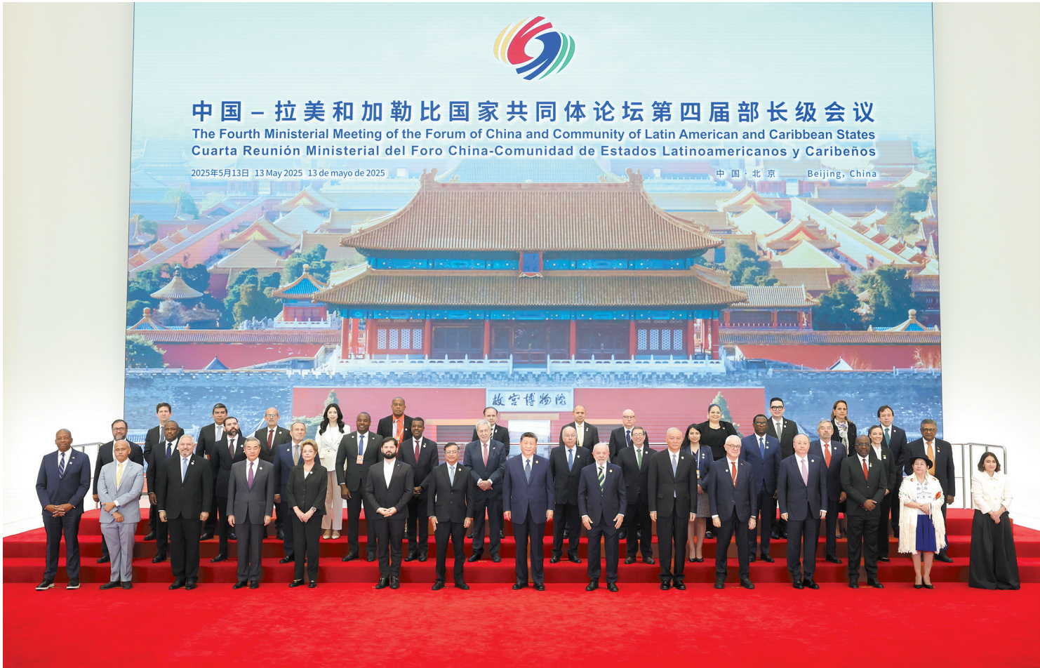
5月13日上午，国家主席习近平在北京国家会议中心出席中国—拉美和加勒比国家共同体论坛第四届部长级会议开幕式并发表主旨讲话。这是习近平同与会嘉宾集体合影

新华社电 5月13日上午，国家主席习近平在国家会议中心出席中国—拉美和加勒比国家共同体论坛第四届部长级会议开幕式并发表主旨讲话。