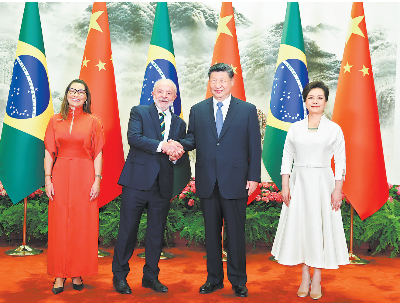
5月13日下午，国家主席习近平在北京人民大会堂同来华进行国事访问的巴西总统卢拉举行会谈。这是习近平和夫人彭丽媛同卢拉和夫人罗桑德拉合影

论坛首届部长级会议开幕式，宣告中拉论坛成立。10年来，在双方精心培育下，中拉论坛已经从一棵稚嫩幼苗成长为参天大树。（下转A2）