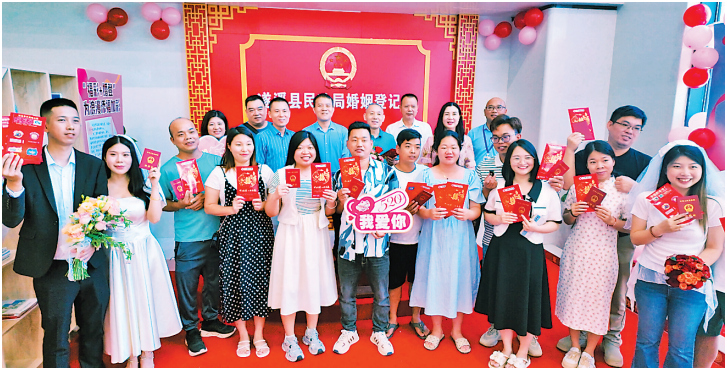
新人们手持福袋幸福合影

5月20日，湛江市民政局、遂溪市民政局、湛江市福利彩票发行中心联合举办“中国福彩·为爱添彩”结婚新人赠彩活动，为当天登记结婚的新人送上美好的祝福，让新人们体验“随手公益”的乐趣。 活动期间，每对新人获赠一份印有“龙凤双喜”的福彩福袋。现场特别设置了婚俗新风宣传展板，新人们手持福袋幸福合影。通过“福彩+婚庆”融合模式，将甜蜜的婚礼与公益福彩相结合，让他们在喜庆的日子认识福彩、了解福彩，体验刮彩乐趣，支持福彩公益事业；同时，让婚礼成为传播公益的窗口，助力倡导婚事简办、喜事新办的文明新风尚。