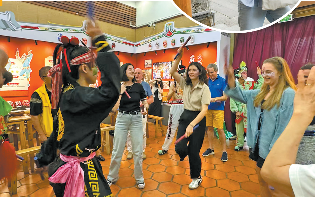
法国旅行商感受英歌舞等广东文化魅力