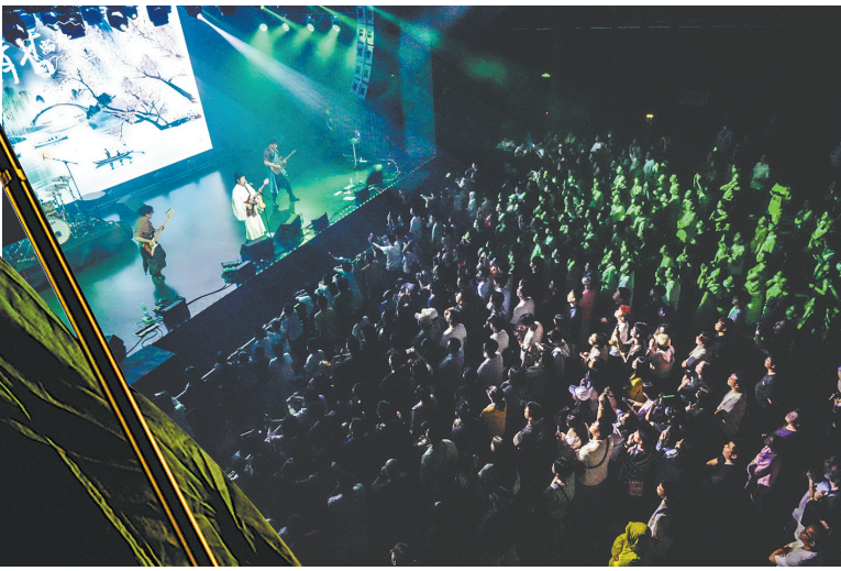
“尚能饭”乐队每次演出都有大批粉丝捧场