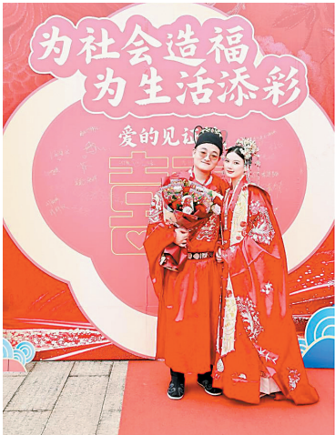
新人手捧“喜相逢”即开票花束图/佛山福彩