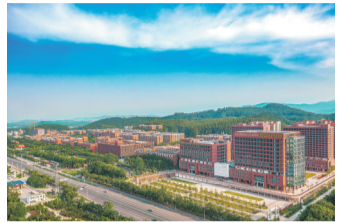
广州华商学院广州校区全景图

国际化联合培养:开设8个专业的国际班,与全球5个国家9所知名高校联合培养具备全球视野的国际化人才,为学生搭建国际化实践平台,显著提升语言能力、创新能力和全球就业竞争力。