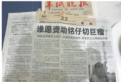
2001年11月22日,羊城晚报《谁愿资助铭仔切巨瘤?》报道

徐克成,1940年8月出生,著名消化病专家和肿瘤治疗专家,广州复大肿瘤医院创始人、荣誉总院长。在中国率先开展肿瘤冷冻消融治疗,是全世界经皮冷冻治疗胰腺癌技术的首创者之一。近年来致力于癌症康复领域,首创将氩气医学和复合免疫引入癌症康复。曾获“白求恩奖章”、被授予“时代楷模”等殊荣。