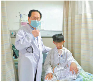
长大后的铭仔曾因病返回广州复大肿瘤医院治疗,徐克成始终心系其健康