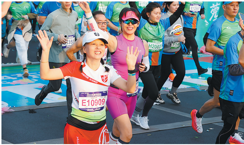
各类体育项目在东莞蓬勃发展

会相关比赛,推动本土企业参与赛事赞助和赛会产品销售、制造,构建“赛事IP+潮玩”联动发展模式。