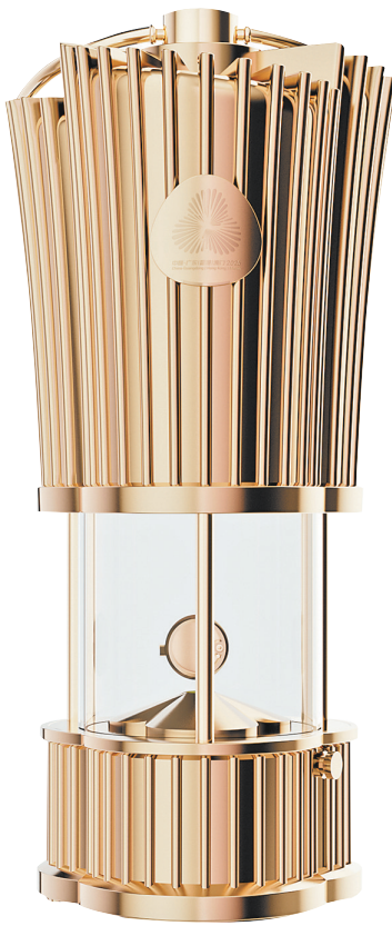
火炬“绽放”内部结构

要组成部分。颁奖音乐不仅要表达对获奖运动员的崇高敬意、传递情感,更要彰显赛事特色和时代精神。本届全运会颁奖音乐创作工作于 2025 年 4 月初正式启动,由广州体育学院音乐教师团队精心打造。过程中广泛征求专家学者及粤港澳三地意见,借鉴过往颁奖