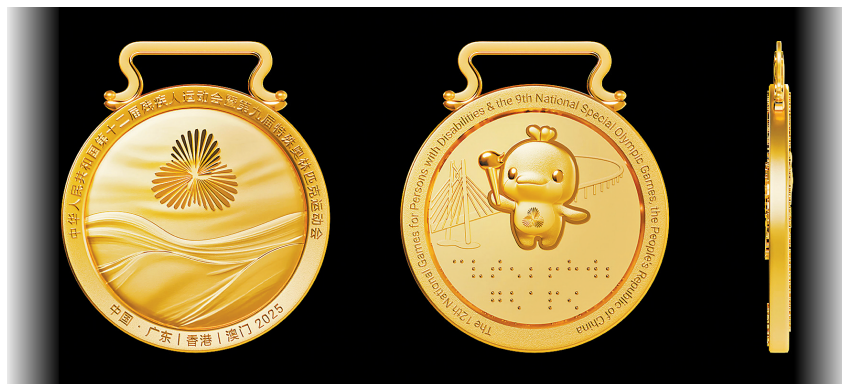
残特奥会奖牌“同心暖”

音乐成功经验,最终形成了涵盖颁奖仪式全流程(提示音乐、入场音乐、颁奖音乐、退场音乐)的四首系列作品,目前该系列音乐已按程序上报国家体育总局,并在当前赛事上使用。