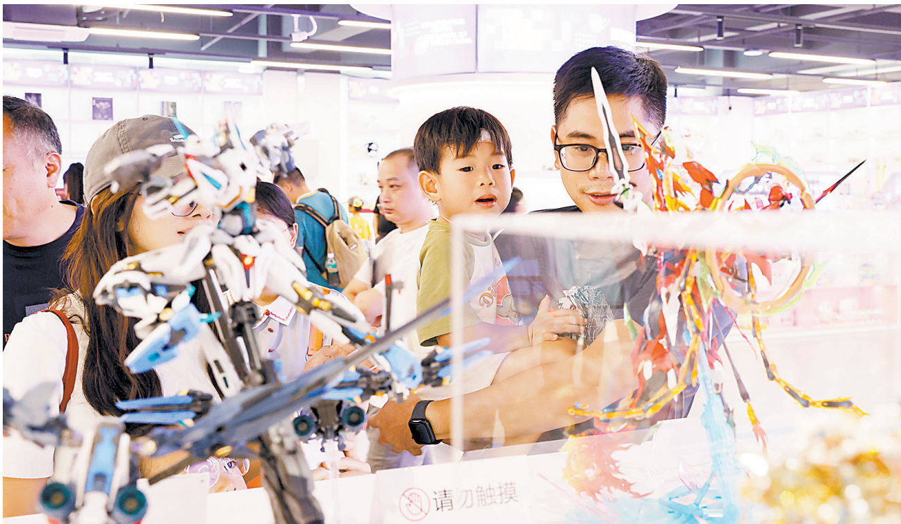
这个周末东莞不少市民全家逛漫博会

广东威斯潮玩今年已是第8次参加漫博会，创新的办展模式让企业参展有了新惊喜。“漫博会给了客户信心和决心，主动确定了合作。”该公司总经理李文波介绍称，展会上，威斯公司与日本企业确定了近一亿元的订单，此前该客户对合作尚有顾虑，到展会现场见证公司产品质量和产业链配套后，迅速敲定了合作。他说，潮玩作为文化载体，吸引大