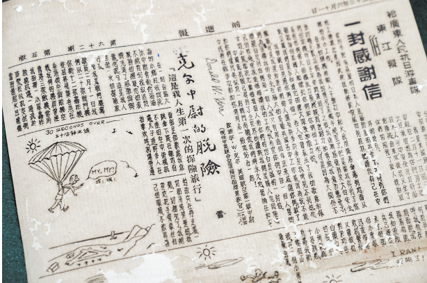
1944年6月11日《前进报》

港九大队英勇行为的褒奖,更是中国共产党领导的抗日武装与国际反法西斯力量并肩作战的历史见证。