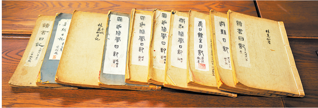
归藏中大的10本抗战日记 学校供图

不幸的是,林氏三姐弟皆殉难于1945年的客轮事故。1945年抗战胜利,中山大学、岭南大学的潮籍学生廖集汕头,拟乘轮船赴校报到。然而大战