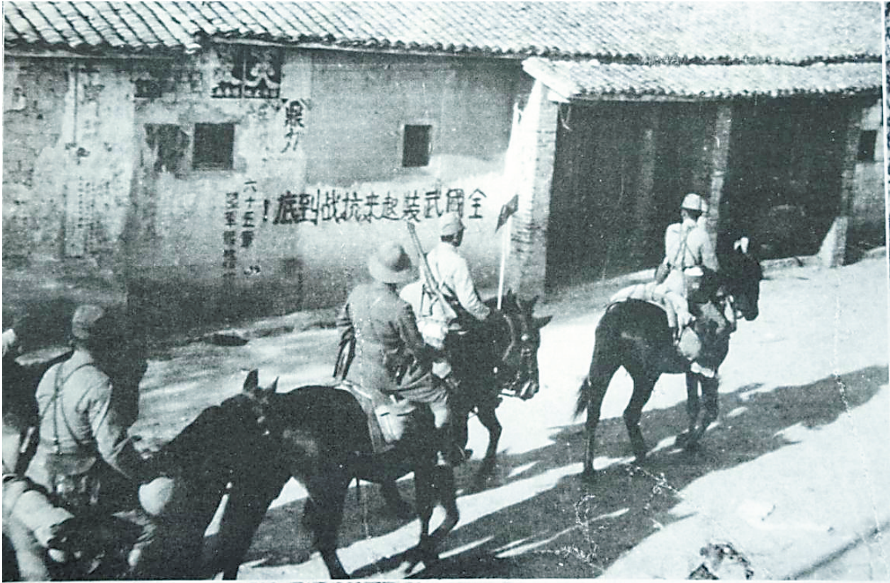
日军侵略罪行照片中,出现了广东省韶关市翁源县的抗战标语“全国武装起来抗战到底!”

脱险后的克尔写下了一封情真意切的感谢信,信中写道:“看到你们伟大组织的力量,机敏周密毅力和勇敢,我愈加惊奇了!”这不仅是对东江纵队