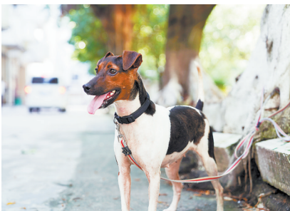
“坚五”通过考核,成功“出师”

羊城晚报讯 记者张小悦,通讯员番公宣、张梦彦摄影报道:广州公安“汪汪队”来新丁了!8月14日,记者从广州番禺公安获悉,经过近一年训练,本土犬种警用太仓犬“坚五”通过考核,成功“出师”。在即将到来的十五运会和残特奥会安保中,“坚五”将大展身手,“犬”力以赴。