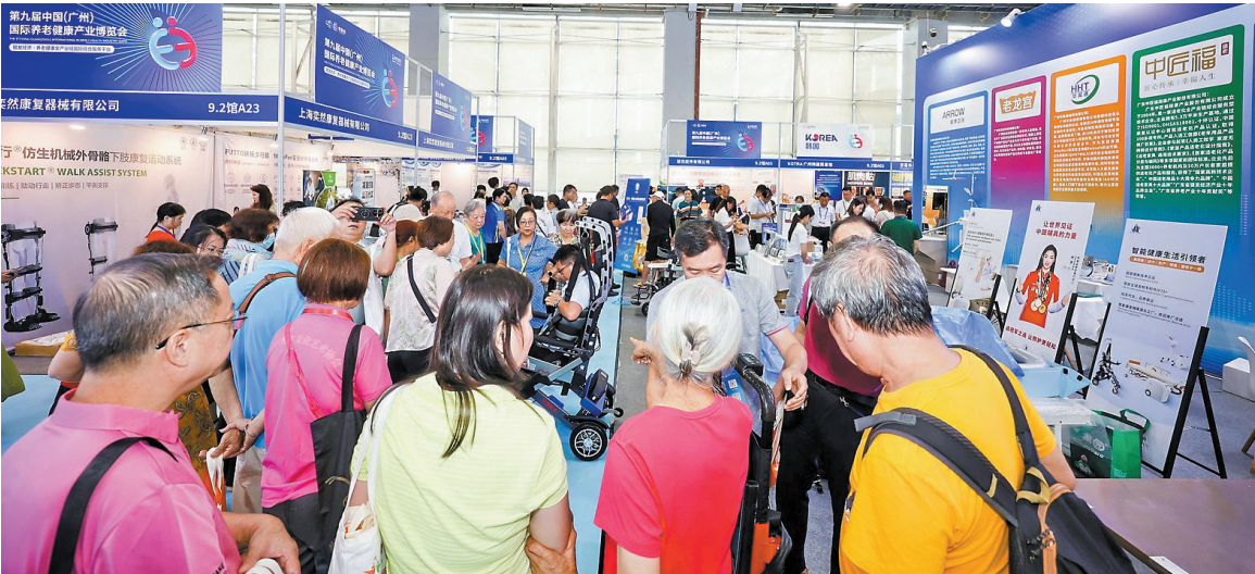
老博会现场,“银发族”进行产品体验

“广州民政”展位设有银发经济供需对接洽谈区,以现场洽谈、项目推介、合作招募等形式,搭建供需对接、资源链接平台,为银发经济创新联合体招募龙头企业、高校院所、各类创新主体等,协同构建广州银发经济创新生态圈。