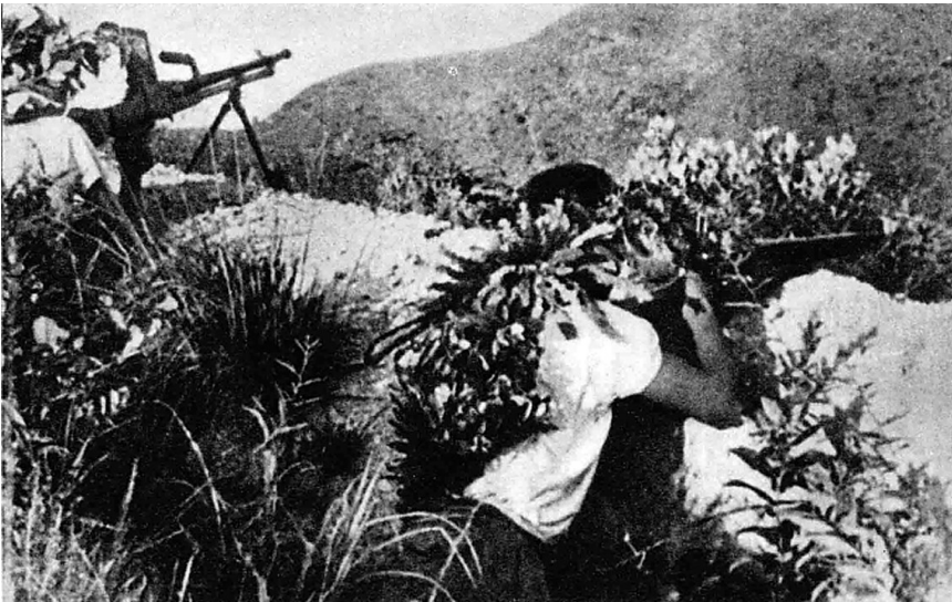
东江抗日游击队袭击日军

其次，组织回乡服务团。1939年1月，在中共东南特委策动下，东江华侨回乡服务团在惠阳县淡水成立，积极发动华侨青年回国回乡参加战斗。抗战期间，爱国华侨和港澳同胞组织的回乡服务团总数达30多个，活动足迹遍布东