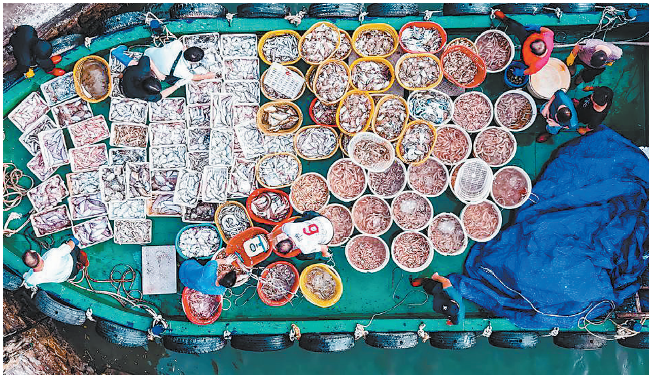
开渔季“海获”满船(资料图片)

素以“会玩”著称的广东人,在这个夏天继续玩得“精专”。 羊城晚报记者从岭南集团旗下广之旅了解到,今年暑期该社定制旅游、