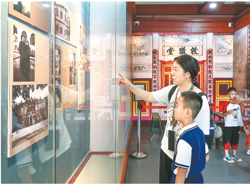
“中国文化名人大营救专题展”展览现场