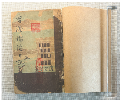
萨空了《香港沦陷日记》