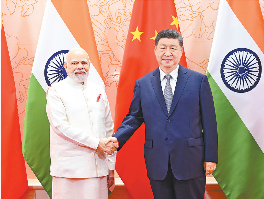
8月31日中午，国家主席习近平在天津迎宾馆会见来华出席2025年上海合作组织峰会的印度总理莫迪