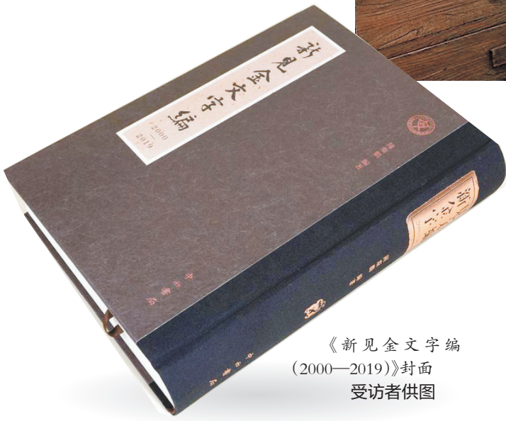
《新见金文字编(2000—2019)》封面